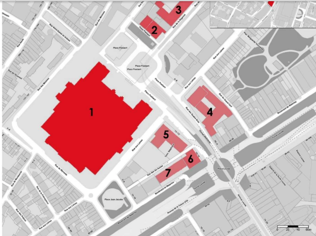
Plan du Campus Poelaert © Thierry Henrard et Thomas Greck, architectes, janvier 2021.