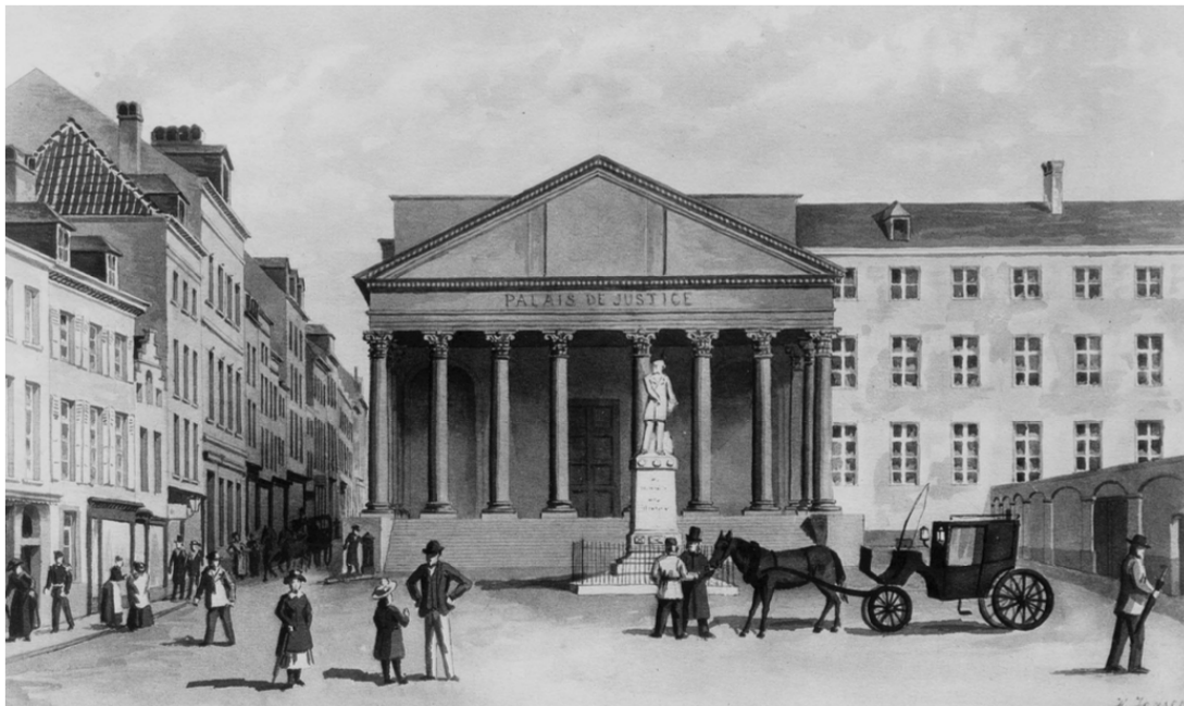
Le premier Palais de Justice. Dessin de Harald Jensen, 3 e quart du XIX e siècle.

La rue de Ruysbroeck se trouve sur la gauche.