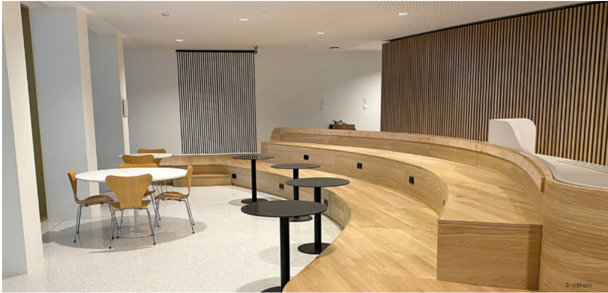
Polyvalente ruimte

We hadden ook het genoegen de kluizenzaal ontworpen door Jules Wabbes te bezoeken. De soberheid van deze grote ruimte met strakke lijnen, de keuze van precieze materialen - brons en graniet - de rijkdom van het plafond met haar subtiel lichtspel maken het tot een van de grote successen van deze designer ... een pareltje om absoluut te koesteren.