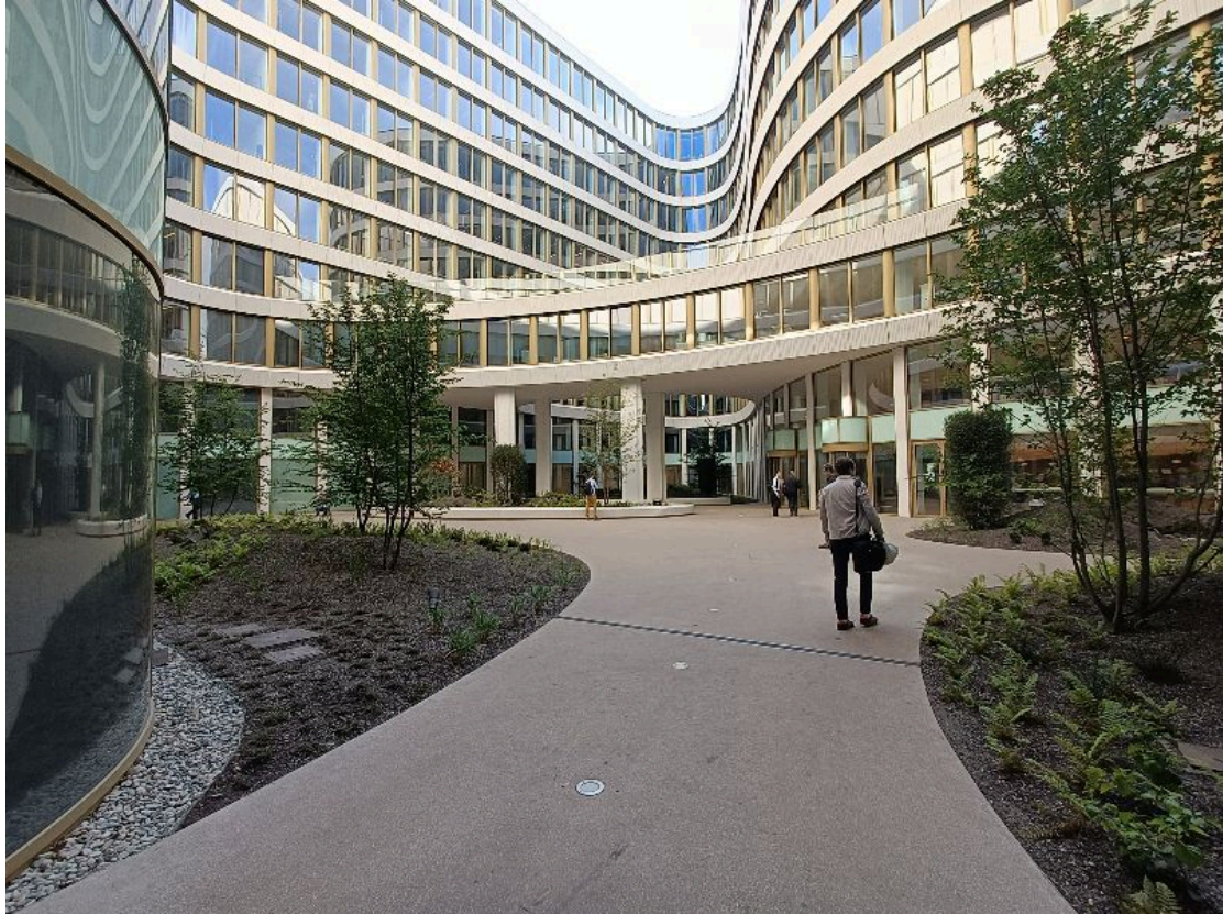
Publieke binnenkoer van het BNP Paribas Fortis gebouw, Warandeborg

Hoewel dit niet het eerste gebouw is dat is ontworpen om nieuwe samenwerkingsvormen te bevorderen, blijven we onder de indruk. De luchtige ruimtes in het gebouw verpulveren het traditionele imago van bedrijfskantoren. De stress van de bancaire activiteiten wordt weggehaald door gedeelde plateaus, kantoren georganiseerd rondom twee atriums, met in de buurt telkens een cafetaria, kunstwerken en precies gedoseerde verlichting. Een blik op het atrium, gespreid over vier verdiepingen, toont ons het spel van rondingen en vloeiende bewegingen van de muren die de monotonie van de raamkozijnen helemaal doen vergeten.