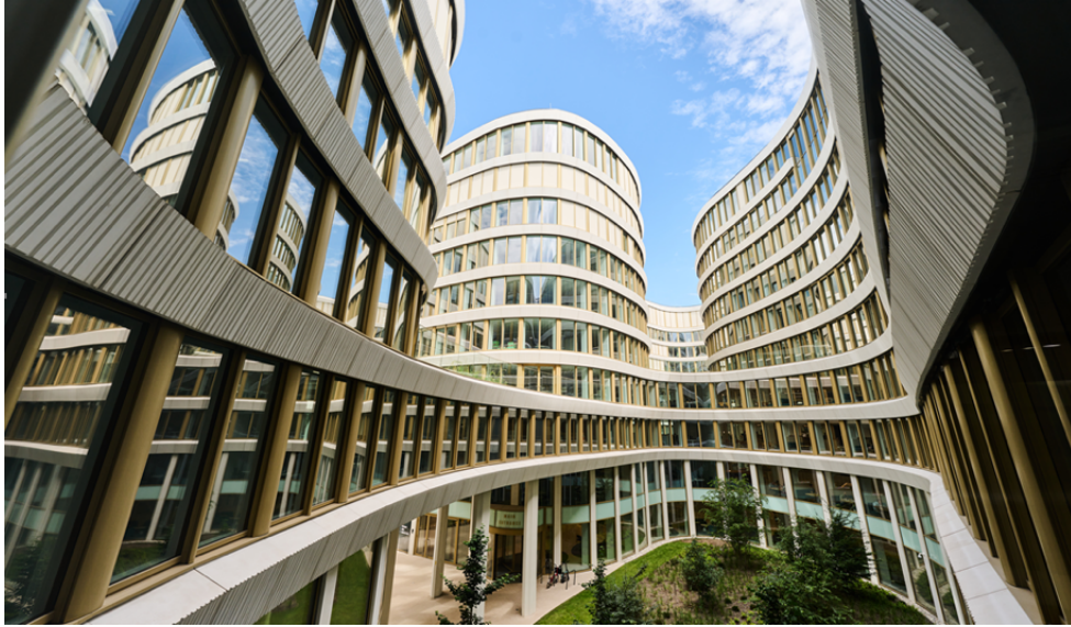
Cours intérieures du nouveau bâtiment BNP Paribas Fortis, Montagne du Parc