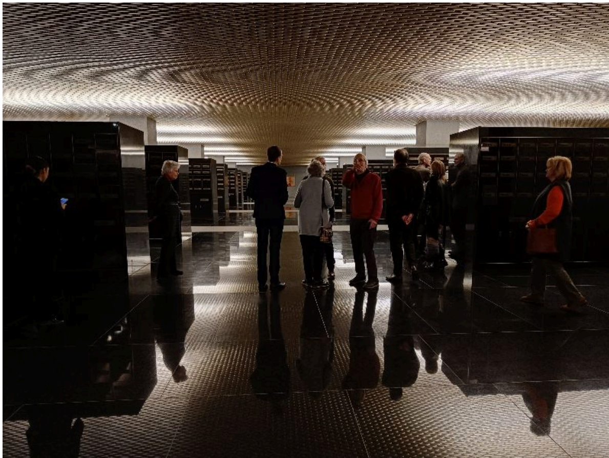
La salle des coffres décorée par Jules Wabbes

Enfin, nous avons eu un vrai coup de cœur pour l'escalier intérieur qui est un des plus réussis qu'il nous a été donné de voir en Belgique. Au zig-zag de l'escalier répondent très justement les courbes des ouvertures à chaque étage, jusqu'à l'arrondi de la baie vitrée qui finit cette envolée.