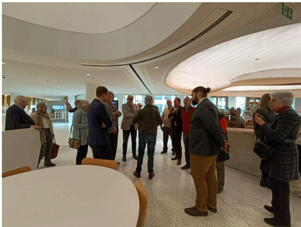
Atrium du nouveau bâtiment BNP Paribas Fortis (quatre étages)

Nous avons aussi eu le bonheur de visiter la salle des coffres conçue par Jules Wabbes. La sobriété de cette immense salle aux lignes épurées, le choix des matériaux - bronze et granite – la richesse du plafond sensible aux jeux de lumière en font une des grandes réussites de ce maître du design ... qu'il fallait absolument maintenir in situ.