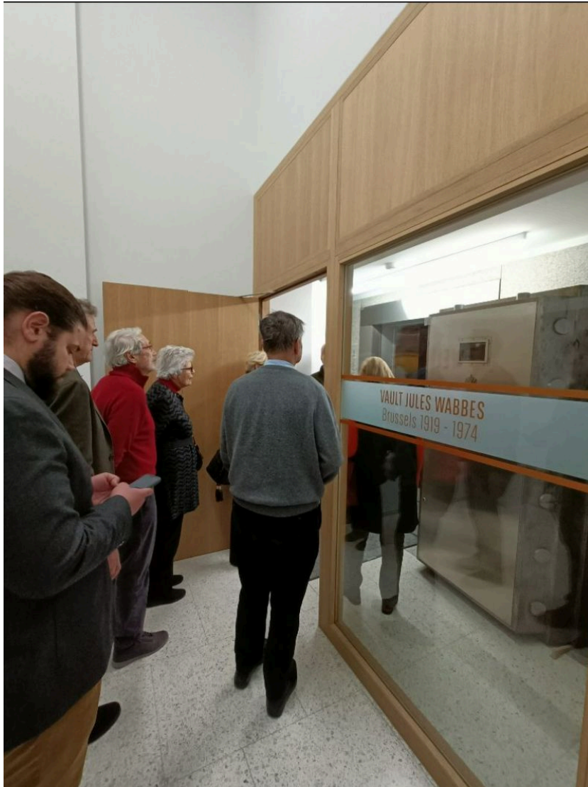
Via de enorme deur (achter glas rechts) naar de kluizenzaal door Jules Wabbes

Tot slot hoedje af voor de monumentale binnentrap, een unicum in België. De zigzag van de trap sluit perfect aan op de ronde openingen op elke verdieping, tot helemaal boven, waar ze uitgeeft op een rond afgewerkte glazen wand.